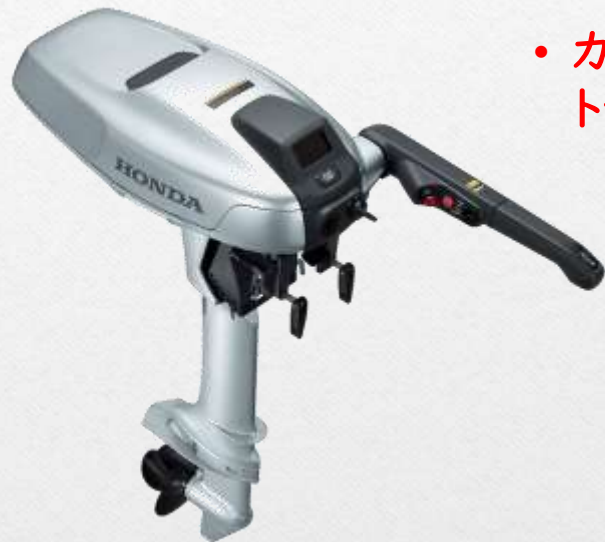
小型船舶用 4 kW電動推進機 プロトタイプ

Honda 社が、水上のカーボンニュートラル実現 に向けて開発する小型船舶用電動推進機