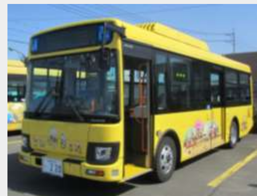
イエローバス(安来市コミュニティバス)