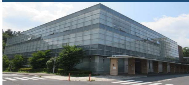
保健福祉総合センター (こども家庭支援課)