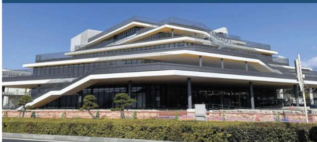
本庁 (保育所幼稚園課)