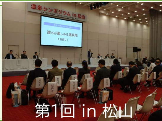
第1回 in 松山