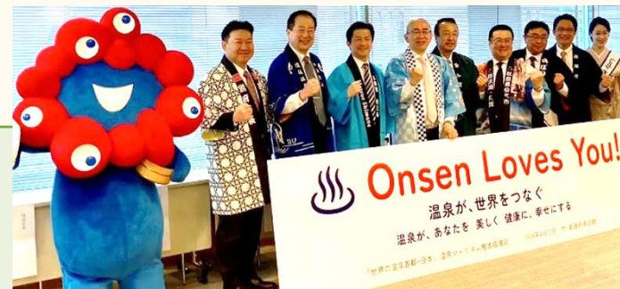
▲ 温泉ツーリズム推進協議会発足時の記者発表(令和6年4月10日)