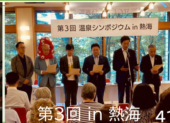
第3回 in 熱海