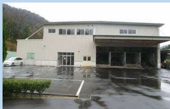
川向リサイクルプラザ 西持田リサイクルプラザ