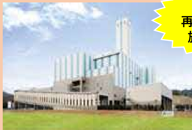
ごみ処理施設「エコクリーン松江」