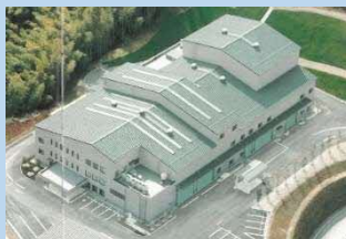
西持田最終処分場 西持田不燃物処理場