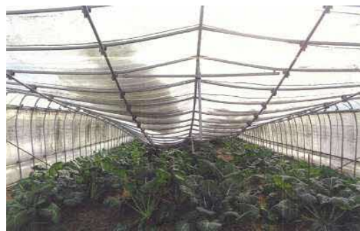
市内ビニールハウスの被災状況 (例)