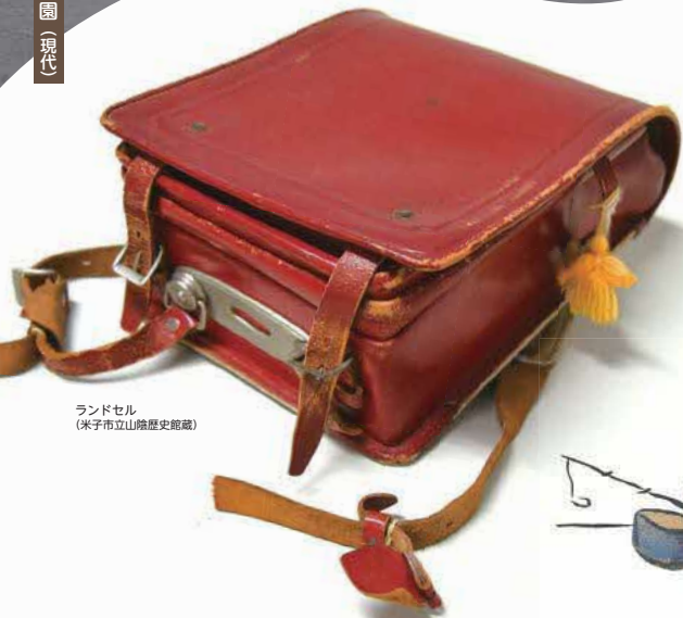
ランドセル （米子市立山陰歴史館蔵）