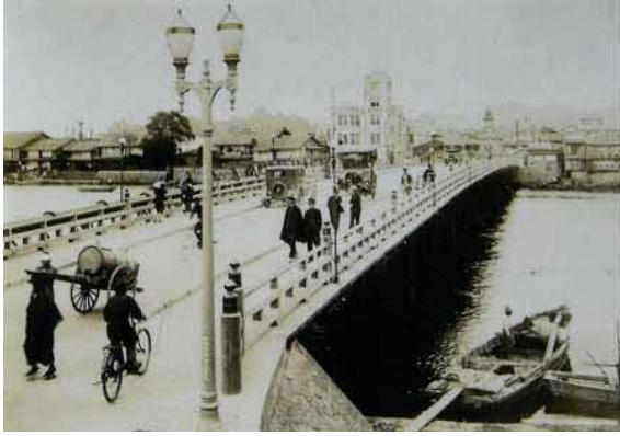
16 代大橋(松江大橋) 明治 44 年(1911)竣工。