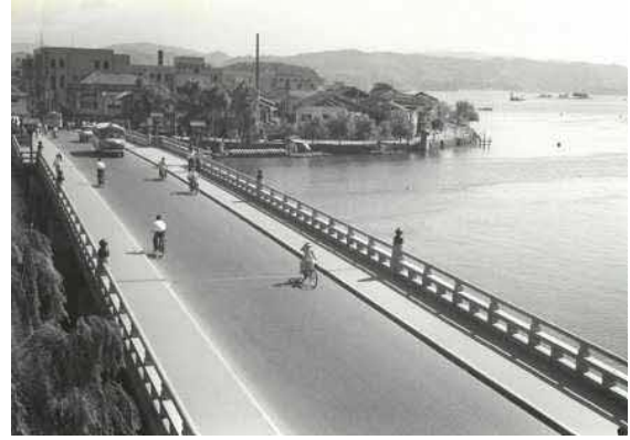
17 代大橋(松江大橋) 昭和 12 年(1937)竣工。