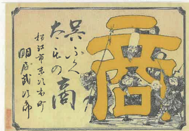
14.「商」に七福神 〈末次本町 明石武次郎〉 明治時代