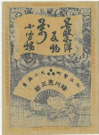
3. 雲龍と牡丹 〈豎町 絹川恵三郎〉 明治時代