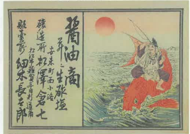
10.鯛乗りエビス 〈雑賀町三丁目新道南 細木長太郎〉 明治時代