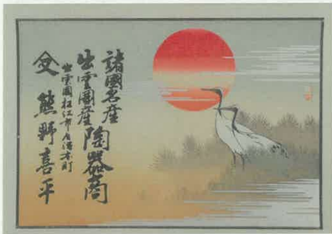
8.日の出と鶴 〈白潟本町 熊野喜平〉 明治時代