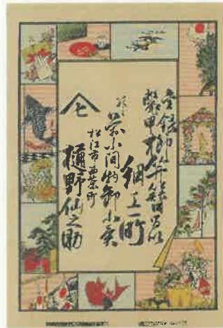
4. 歳時記 1 2 種 〈西茶町 榎野仙之助〉 明治26年(1893)