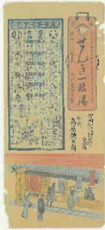
1. 曆と店先 〈八軒屋町 鳥屋新兵衛〉 文久2年(1862)