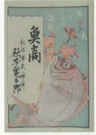
7. 鯛と桜 〈天神町 秋本亀太郎〉 明治時代