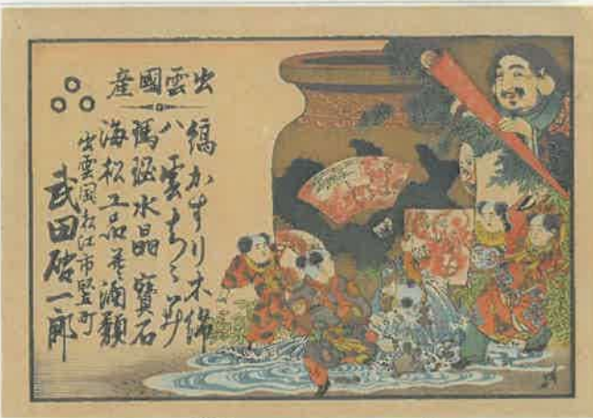
12.壺割童子とダイコク 〈豎町 武田啓一郎〉 明治時代