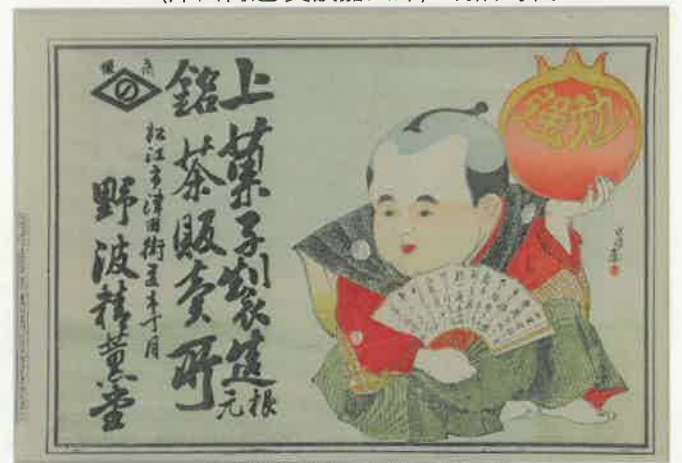
13.がまぐちを持つ福助 〈津田街道一丁目 野波精薫堂〉 明治29年(1896)