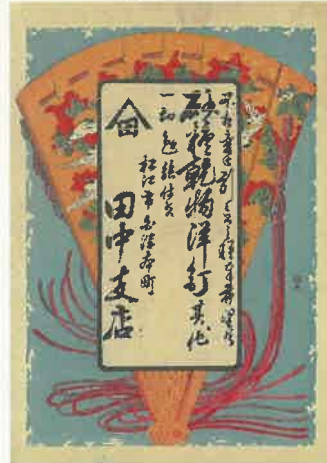
6. 檜扇 〈白濁本町 田中支店〉 明治時代