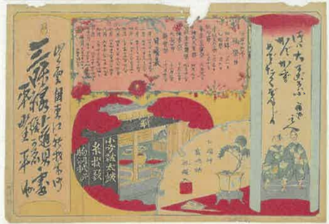
2. 曆と店先 〈新材木町 平野平助〉 明治15年(1882)