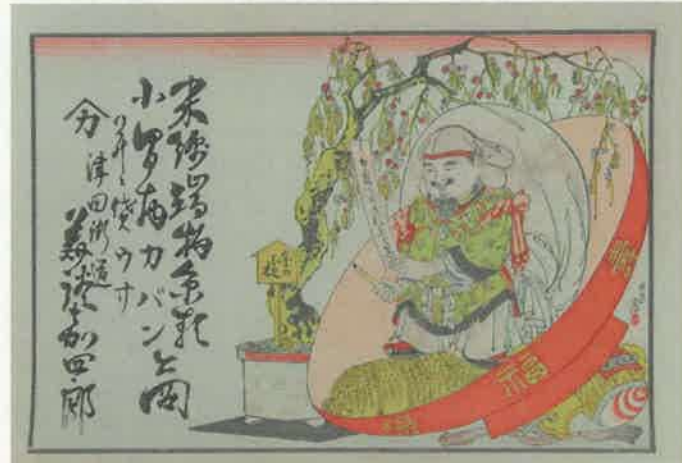
11.ダイコクと金の成る木 〈津田街道 美談嘉四郎〉 明治時代