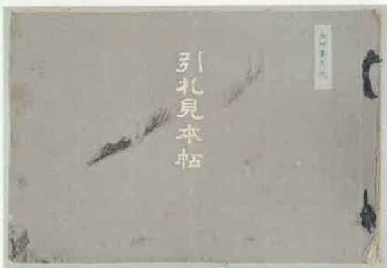
16. 引札見本帳 明治32年(1899)頃

明治中期には機械印刷で大量に安く印刷できるようになる。 各商店は引札の見本帳から好きな図柄を選び、注文した。