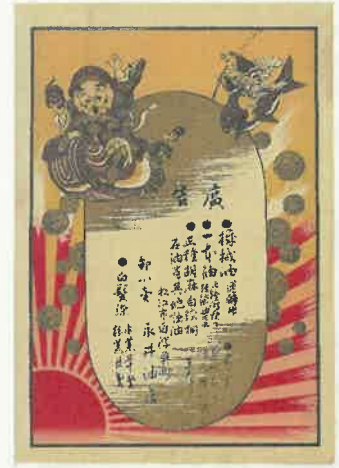
5. 飛ぶダイコクとエビス、貨幣 〈白濁魚町 永井油店〉 明治時代