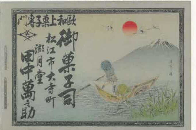
15.富士山と紙幣の舟での藻狩り 〈大寺町 湖月堂 田中萬之助〉 明治29年(1896)