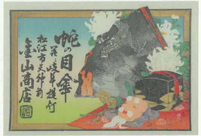
9.宝尽くし 〈天神前 金山商店〉 明治時代