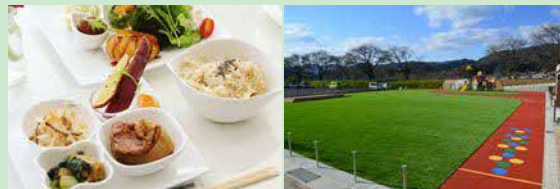
▲ veg cafe & health store 『菜の花』 ▲ コトリパーク ☎0854-47-7412

雲南の魅力と中心市街地のにぎわいを生み出すまちのシンボルとして 2019年7月にオープン。施設内のカフェ『菜の花』では、地球とからだに優しいベジランチが味わえ、弁当の宅配も行っている。公園『コトリパーク』は週末には家族連れで賑わう。