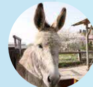
杜のロバ だいず&あずき

雲南の豊かな食の恵みを楽しめる『食の杜』には、ワイナリーやパン屋、豆腐屋などや点在する。食べ物だけでなく、素材にこだわる『革工房 蓄』さんの作品はプレゼントや自分へのご褒美に♪