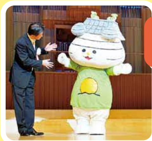
松江市PRキャラクター「おまっちゃん」が初登場！