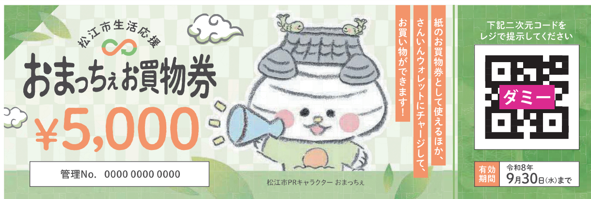
(お買物券イメージ)

※お買物券は、いかなる理由(紛失・盗難・破損など)であっても再発行はできません。