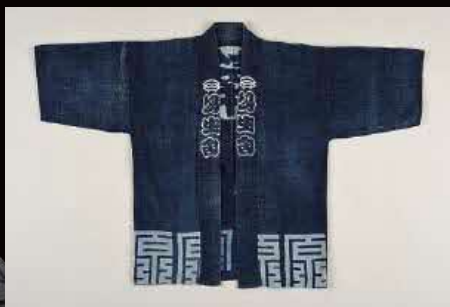
鴻生舎の法被／明治時代／個人蔵