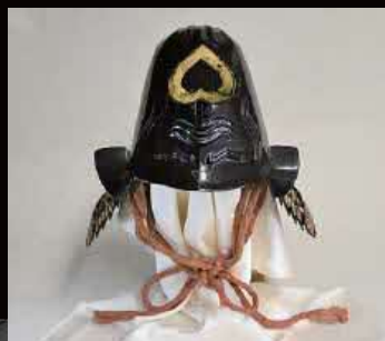
松江藩士の兜／江戸時代／館蔵