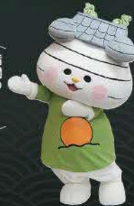
松江市PRキャラクター おまっちゃん