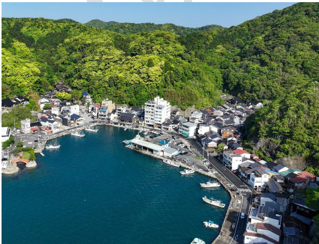
写真1 湾岸に沿った美保関の町並み