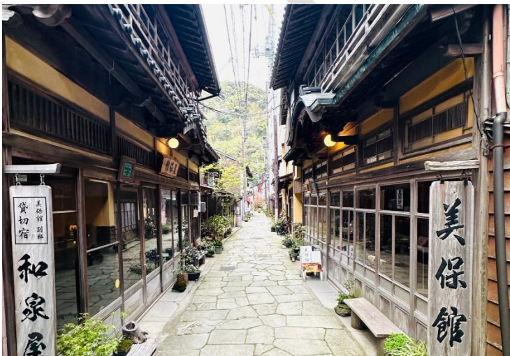
写真2 石敷の本通り沿いに建ち並ぶ町家や旅館建築

保存地区は三方を山が囲み、弓なりの湾岸の狭い土地に細い路地で構成された近世由来の街区と敷地の区画が良く残り、江戸時代から昭和30年代までの町家や大規模な近代の旅館が一体となって、港に広がる門前町としての歴史的な風致を形成する。