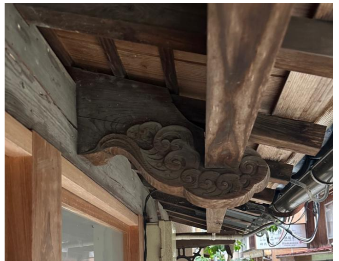
写真3 彫刻を付した装飾的な腕木