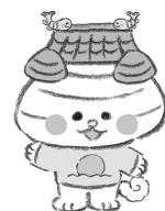
松江市PRキャラクター おまっちょ