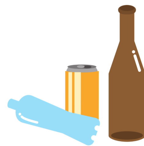
屋外に放置された空きビン・缶・ペットボトル