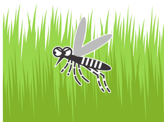
風通しの悪い やぶ・草むら

公園、学校、寺社、空海港、駅などの施設を管理されている方もご協力をお願いします!