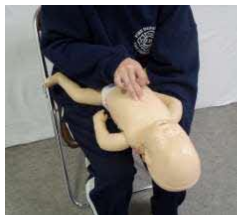
乳児に対する胸部突き上げ法