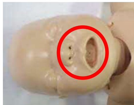
乳児への人工呼吸(口対口鼻)