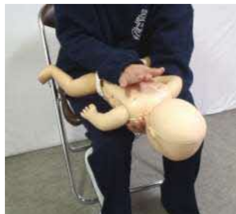
乳児に対する背部叩打法