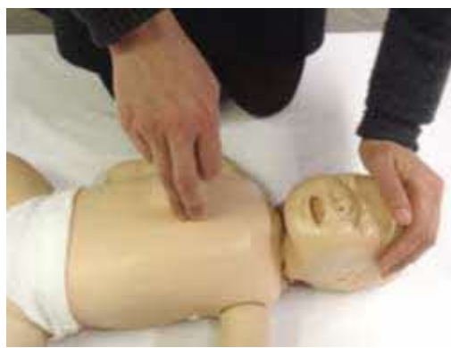
乳児への胸骨圧迫