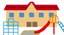
代替保育施設 城東保育所・幼保園のぎ