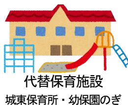
代替保育施設 城東保育所・幼保園のぎ