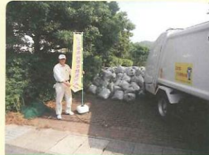
きれいなまち部会