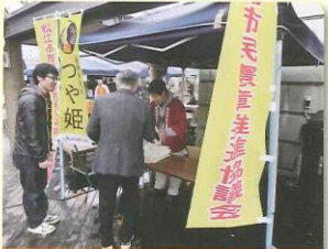
活力あるまち部会