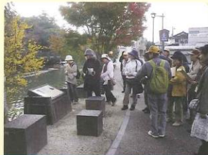
心ゆたかなまち部会