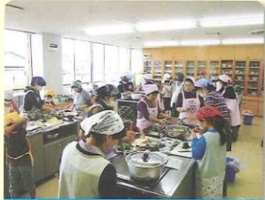
住みよいまち部会