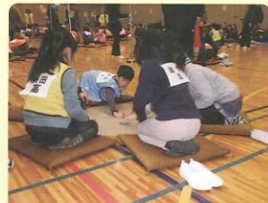
希望あふれるまち部会