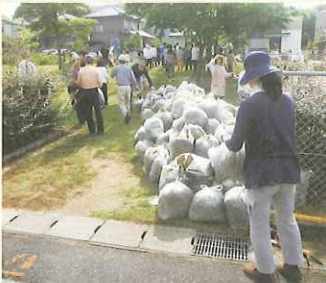
クリーンまつえ運動