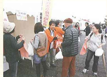
農林水産祭への出店

買い物など日常的にエコバックを利用していただくことで、市民憲章が市民の皆さまの目に触れる機会を増やそうとしています。