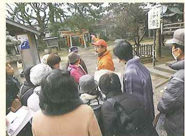
寺町周辺のまちあるき

まちあるきを通して、地域に息づく人々の暮らしぶり、歴史、文化を学び、郷土への愛着を深めるとともに各地域への理解を深め、地域間交流を促進し、心ゆたかなまちづくりを推進しています。