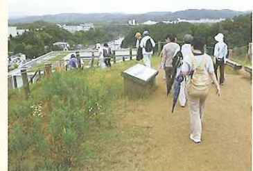
市民憲章ウォーク

平成24年7月1日（日）の「松江市健康福祉フェスティバル」に併せて乃木地区で市民憲章ウォークを開催しました。身近なウォーキングを通じた健康づくりを目的としたもので、コースは5km、ノルディック3km、親子3kmの3種類あり、高齢者の方を中心に参加されました。