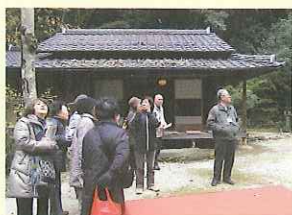
宍道町まちあるきの様子