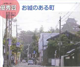
優秀賞 お城のある町