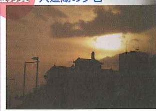
優秀賞 宍道湖の夕日