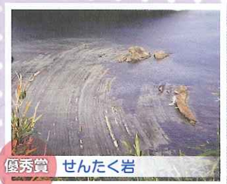
優秀賞 せんたく岩