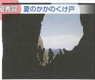
優秀賞 夏のかかのくけ戸