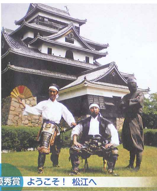
最優秀賞 ようこそ！ 松江へ