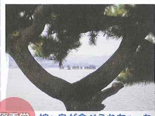
優秀賞 嫁ヶ島が食べられちゃった