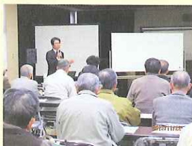
竹矢公民館での講演会の様子