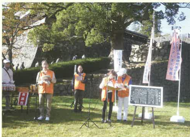
松江城・街美化ウォーク