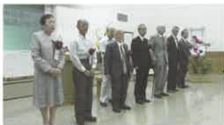
善行者表彰式 (個人の部)