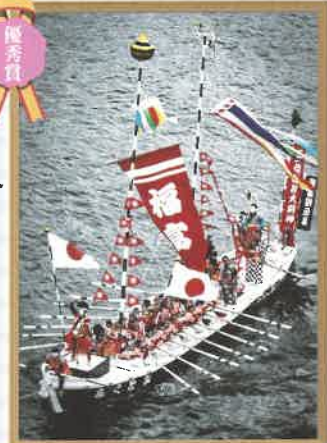
10年に1度のホーランエンヤ 鹿島中1年 森岡 星浩