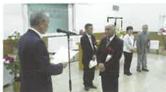
善行者表彰式 (団体の部)