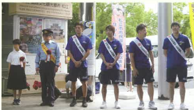
社会を明るくする運動街頭広報活動