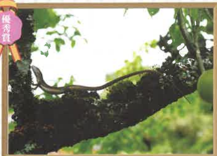
秋吉の梅の木の上でこんにちは！ 八雲中3年 石倉 要