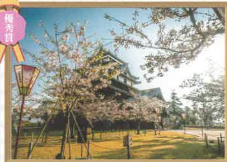
桜さく松江城 津田小3年 田北 悠征