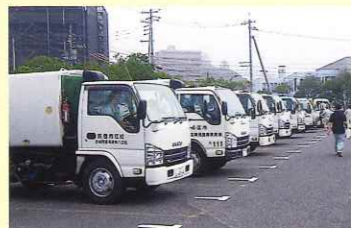
多くのごみを回収することができました