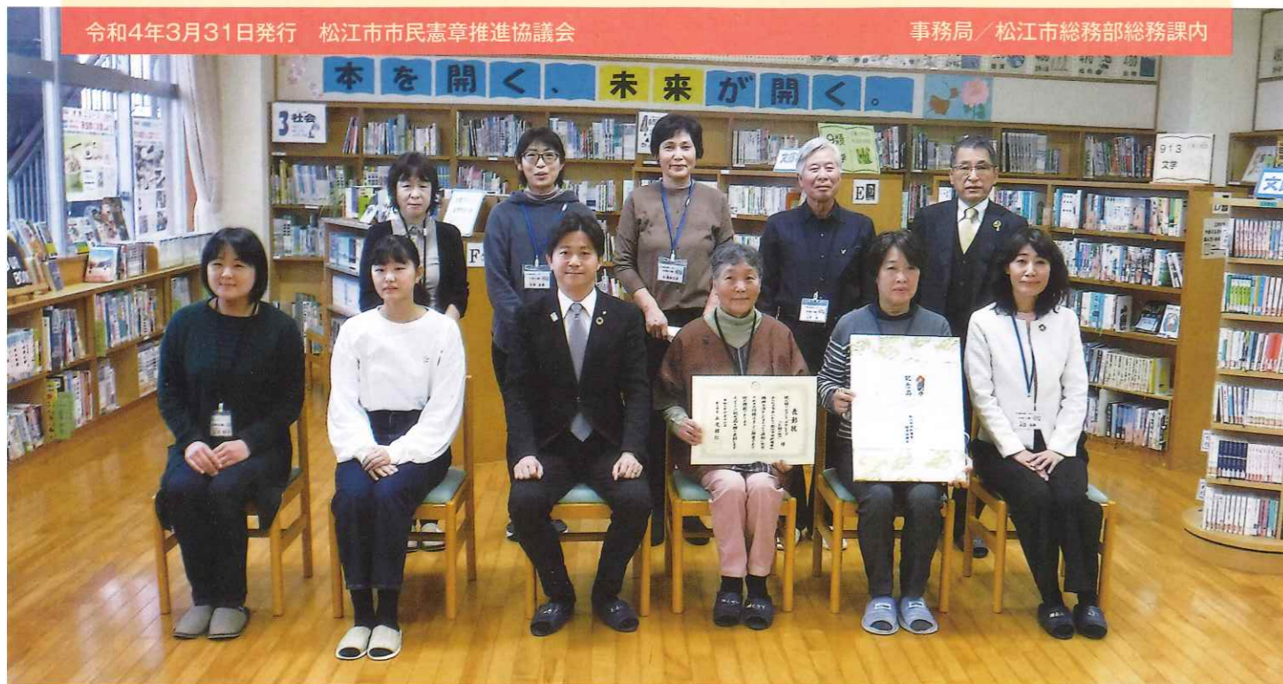
読み語りボランティアグループ「お話し窓」の皆さん