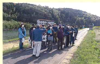
佐陀川沿いの古墳や遺跡を学ぶ