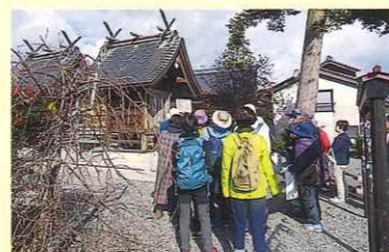
悪縁を立ち良縁を結ぶ田中神社を見学