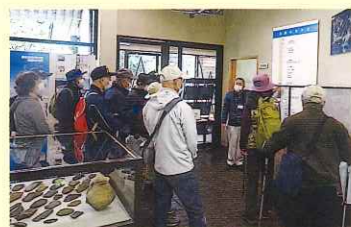
鹿島歴史民俗資料館で事前学習

各地域の歴史・風土散策を通して、地域に息づく人々の暮らしぶり、歴史、文化を学び、郷土への愛着を深めることを目的に、「歴史のまち歩き ～鹿島町 佐陀川をめぐる歴史と遺跡～」を令和3年11月14日(日)に行いました。36名の参加があり、鹿島歴史民俗資料館で、佐陀川周辺の歴史とその周辺の古墳や遺跡について学習し、まち歩きでは、田中神社、佐太講武具塚、旧佐陀川水門、鶴灘山古墳群などをガイドとともにめぐりました。