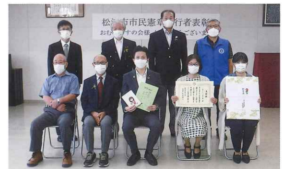
「おむらいすの会」の皆さん