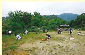
地域の皆さんで清掃活動を行いました

全市一斉での「クリーンまつえ」運動は新型コロナウイルス感染症拡大防止のため中止しましたが、地域の状況等により町内会・自治会等の独自の判断で清掃活動を実施された地域がありました。特に実施が集中した令和3年10月3日に、清掃事業4組合協力のもと「クリーンまつえ」運動に準じた体制でごみの収集作業を行いました。当日は12.45トンのごみを収集しました。