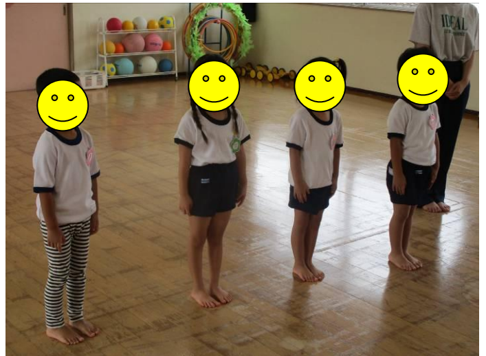
【4人がそろって始業式を迎えました。】

「が い し ま す 。」「 友 だ ち が 増 え て 嬉 し い で す 。よ ろ し く お ね が い し ま す 。」「 2 学 期 の ス タ ー ト で す 。」