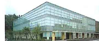
松江市保健福祉総合センター1階