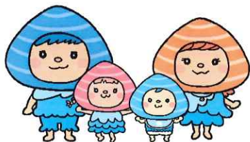
松江市子育て情報発信キャラクター 「しじみ家」