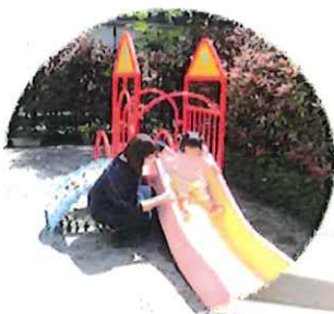
中庭にはすべり台や砂場があるよ♪