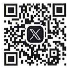
松江市子育て支援 X