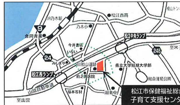
松江市保健福祉総合センター1階 子育て支援センター・あいあい