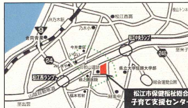
松江市保健福祉総合センター1階 子育て支援センター・あいあい