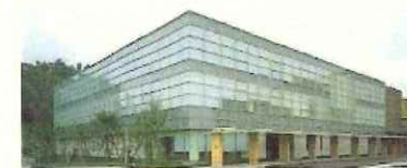
松江市保健福祉総合センター 1F