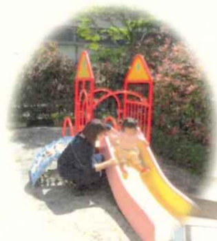
中庭にはすべり台や砂場があります♪