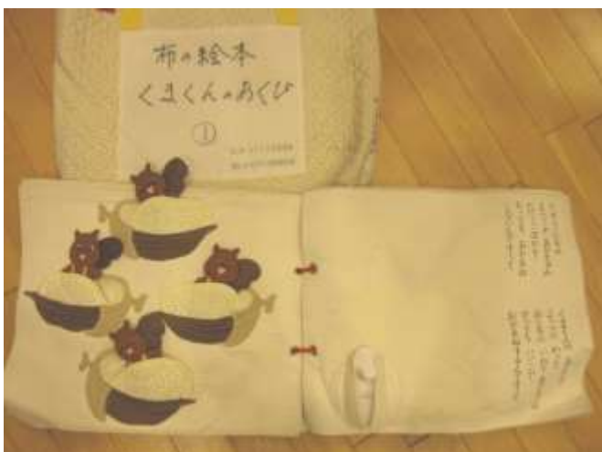
布絵本、小物【きつね②、うさぎ③、りす④、ねずみ⑤、くま、あくび⑩】