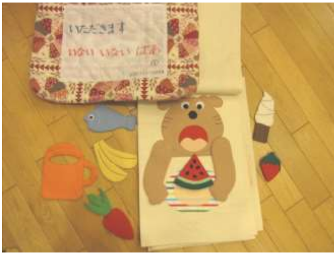
布絵本、小物【ソフトクリーム、ニンジン、バナナ、すいか、魚、いちご、コップ】