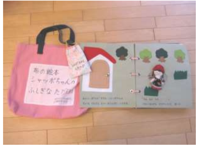
布絵本、小物【しゃっぽちゃん】