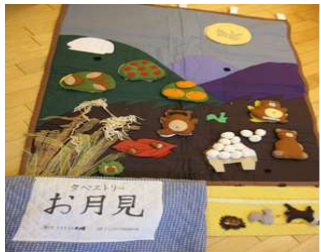
背景、小物袋【たぬき②、くま、りす、むささび、月、団子⑬、みかんの木(みかん付)、りんごの木、くりの木(くり付)、はっば(どんぐり②付)、いがぐり②】