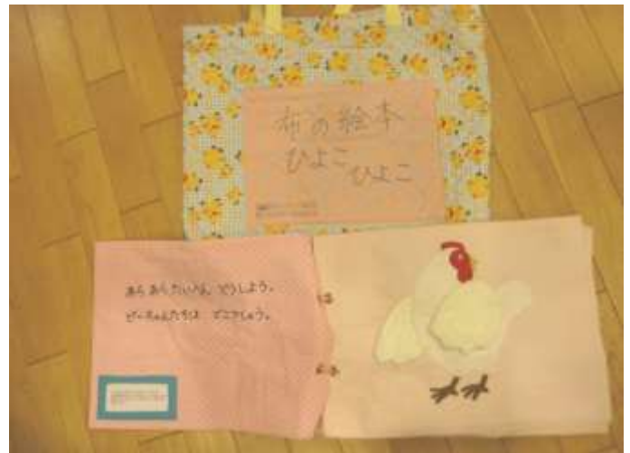
布絵本、小物【ひよこ⑥、金魚】