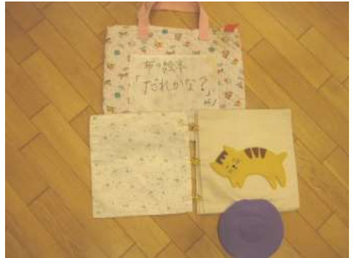
布絵本、小物【ねこ、ピエロ、ゆきだるま】