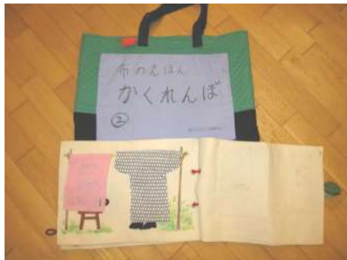
布絵本、小物【おにのお面、にんじん、大根、いぬ、ねこ】