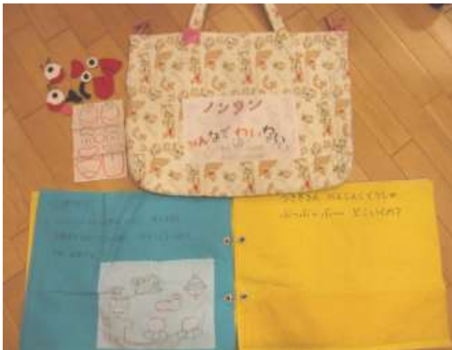
布絵本、顔のパーツ【目④、まゆ②、口③、舌、鼻】