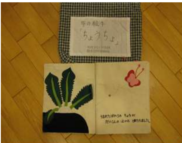
布絵本、小物【ちょうちょ⑤、チューリップ④、リボン、パンジー②】