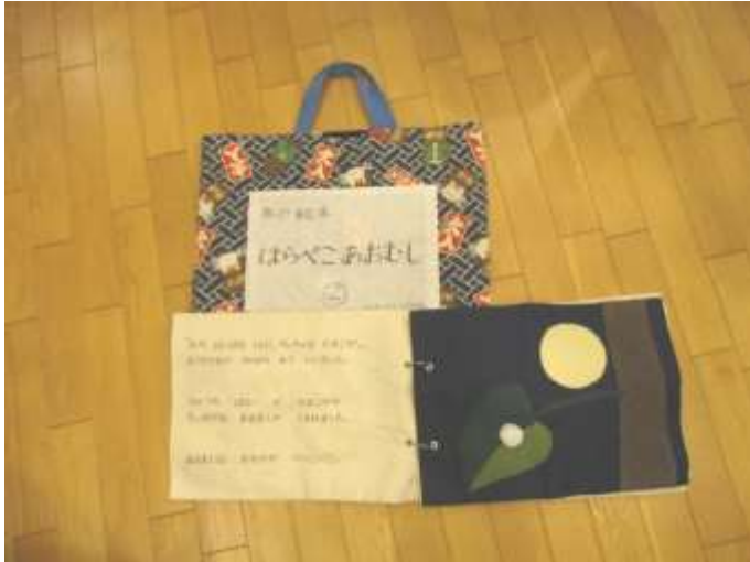
布絵本、小物【すいか、きゅうり、ウインナーソーセージ、アイスクリーム、ペロペロキャンディ、蝶】