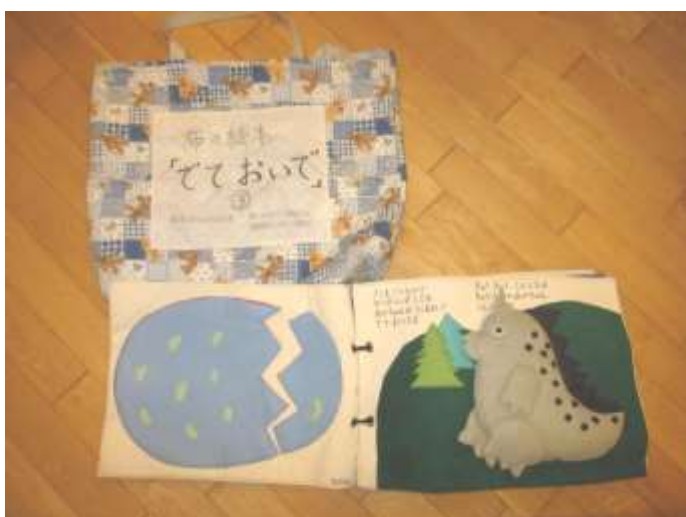
布絵本、小物【きょうりゅう、ペンギン②、ひよこ③、かめ④、わに⑤、へび⑥、おたまじゃくし⑩、かえる】