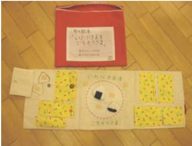
布絵本、小物【おにぎり②、ソフトクリーム、バナナ、団子、フォーク、スプーン、ケーキ、プリン、スイカ】