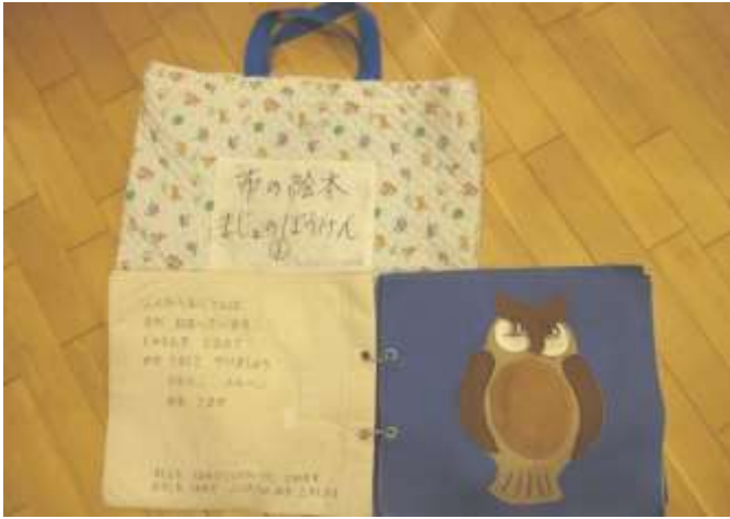
布絵本、小物【ほし⑨、たまご②、おやつ（プリン、りんご、いちご、ドーナツ、みかん、バナナ、キャンディ、ソフトクリーム）】