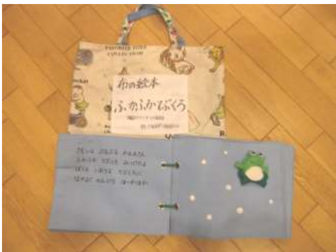
布絵本、小物【ねずみ、かえる、うさぎ、きつね、まの親子】