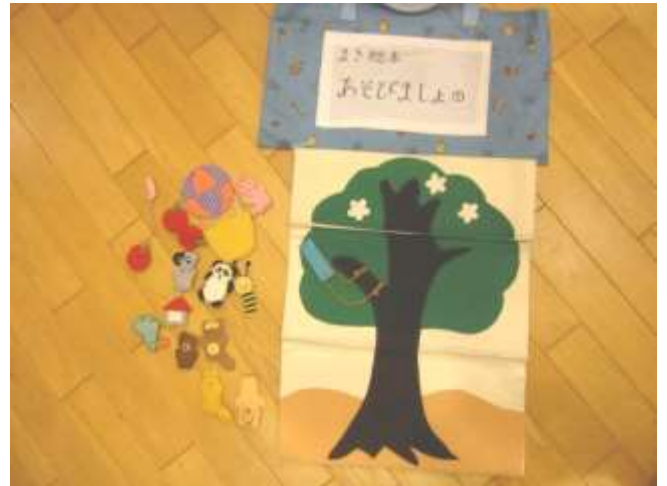
布絵本、小物【気球、うさぎ、きつね、くま、たぬき犬、パンダ、とり、ねこ、毛虫、みのむし、りんご③】