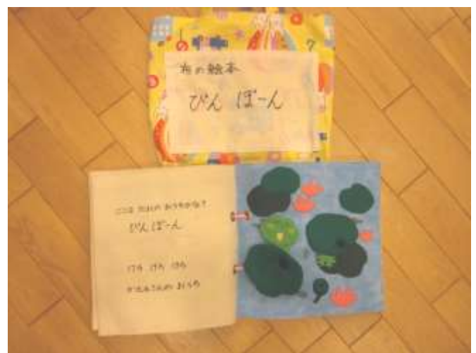
布絵本、小物【男の子、かえる②、あひる、ひよこ②、かたつむり、きりかぶ】