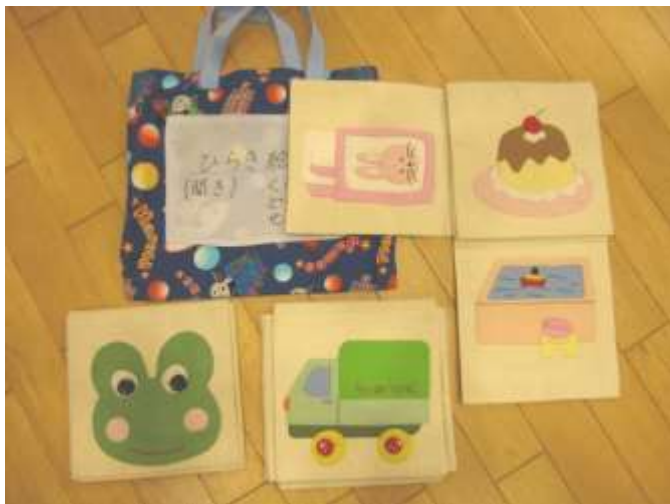
布絵本【どうぶつ、生活、くるま】