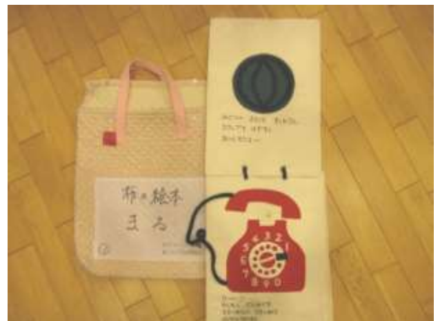
布絵本、小物【すいか、パンダ（目②、耳②、鼻、口）たまご（殻①組）、てんとうむし（模様⑤、顔）、車（タイヤ②、部品②）】