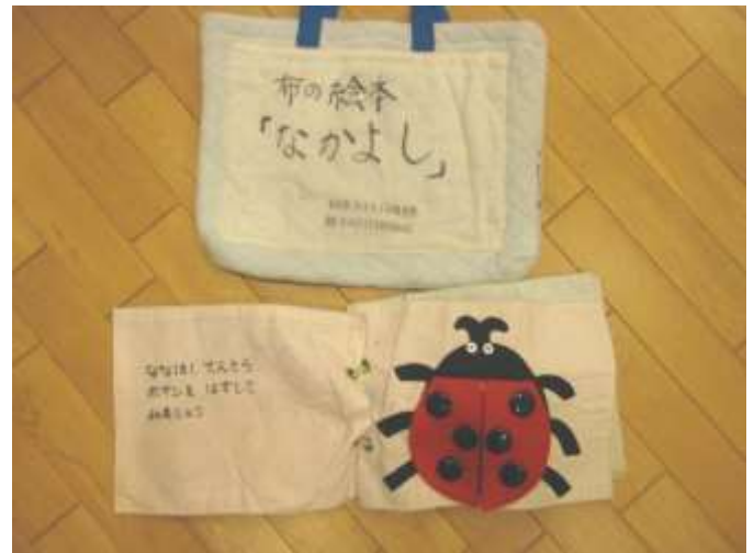
布絵本、小物【さかなの赤ちゃん、弁当、ジュース、アイス、ごはん】