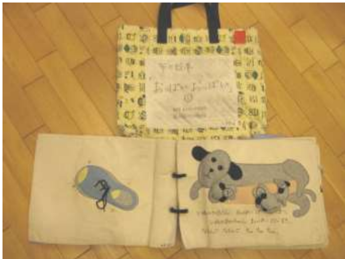
布絵本、小物【さる②、犬⑥、くま②、ふた⑤、牛③くじら、子ども】