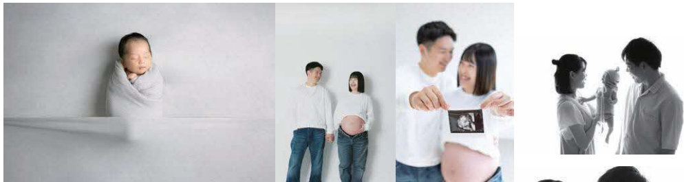
Our most precious treasure.