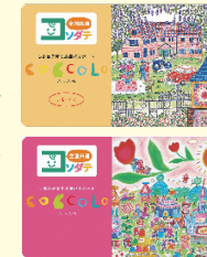
▲上[プレママパスポート] 下[子育て応援パスポート]

必要なもの ..... 妊婦の方は「母子健康手帳」 ※こどもと同居していない場合はマイナ保険証など申請者との続柄や養育関係がわかるものの提示が必要です。 ※パスポートが使用できる協賛店情報など、詳しくは島根県子ども・子育て支援課(☎22-6475)までお問い合わせください。