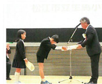
(写真) 表彰校を代表して表彰状と記念品を受け取る城北小学校と生馬小学校のみなさん