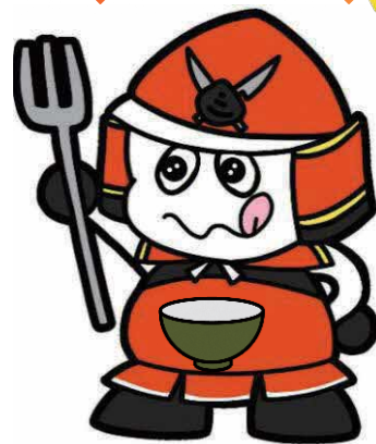
出されたものは残さず食べきる 武者ムシャ君

裏面の「まつえだんだん食べきり運動協力店」登録申請書を記入し、郵送、FAX、Eメール又は持参のいずれかの方法で下記申込先までお送りください。