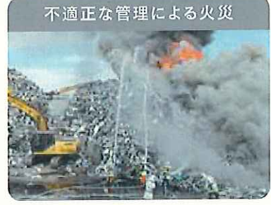
不適正な管理による火災

環境対策を行わずに廃家電を破壊 することで、フロンガスや鉛などの 有害物質が環境中に放出されます。