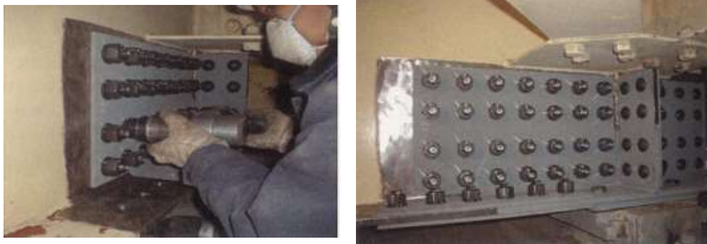
写真 1-1 当て板工実施状況

激しい腐食による鋼部材の減厚が生じた箇所に対し、腐食箇所を取り囲むようにあて板（添接版）を施すことにより鋼部材を補修する工法です。