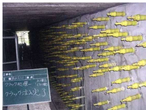
写真 1-2 ひび割れ注入状況

ひび割れを塞ぐことにより、劣化因子（水分、塩化物など）の侵入を防止し、コンクリートの耐久性を向上することができます。