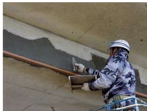
写真 1-3 断面修復状況