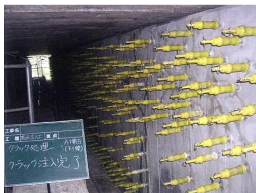
写真 1-2 ひび割れ注入状況

ひび割れを塞ぐことにより、劣化因子（水分、塩化物など）の侵入を防止し、コンクリートの耐久性を向上することができます。