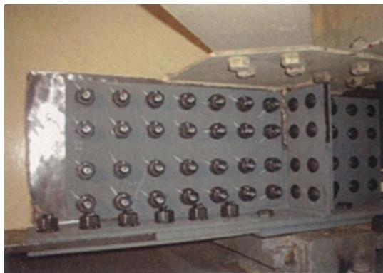
写真 1-1 当て板工実施状況