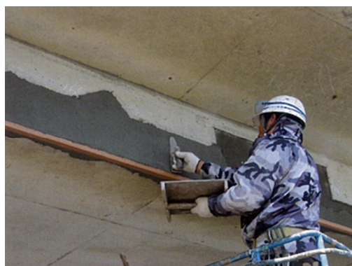
写真 1-3 断面修復状況