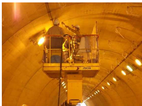
写真5 裏込注入状況