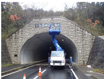
写真1 トンネル点検状況