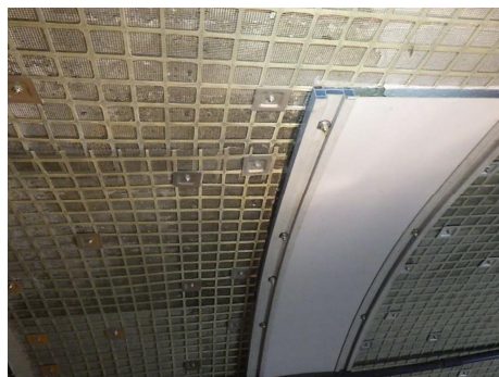
写真4 線導水工+ネット工