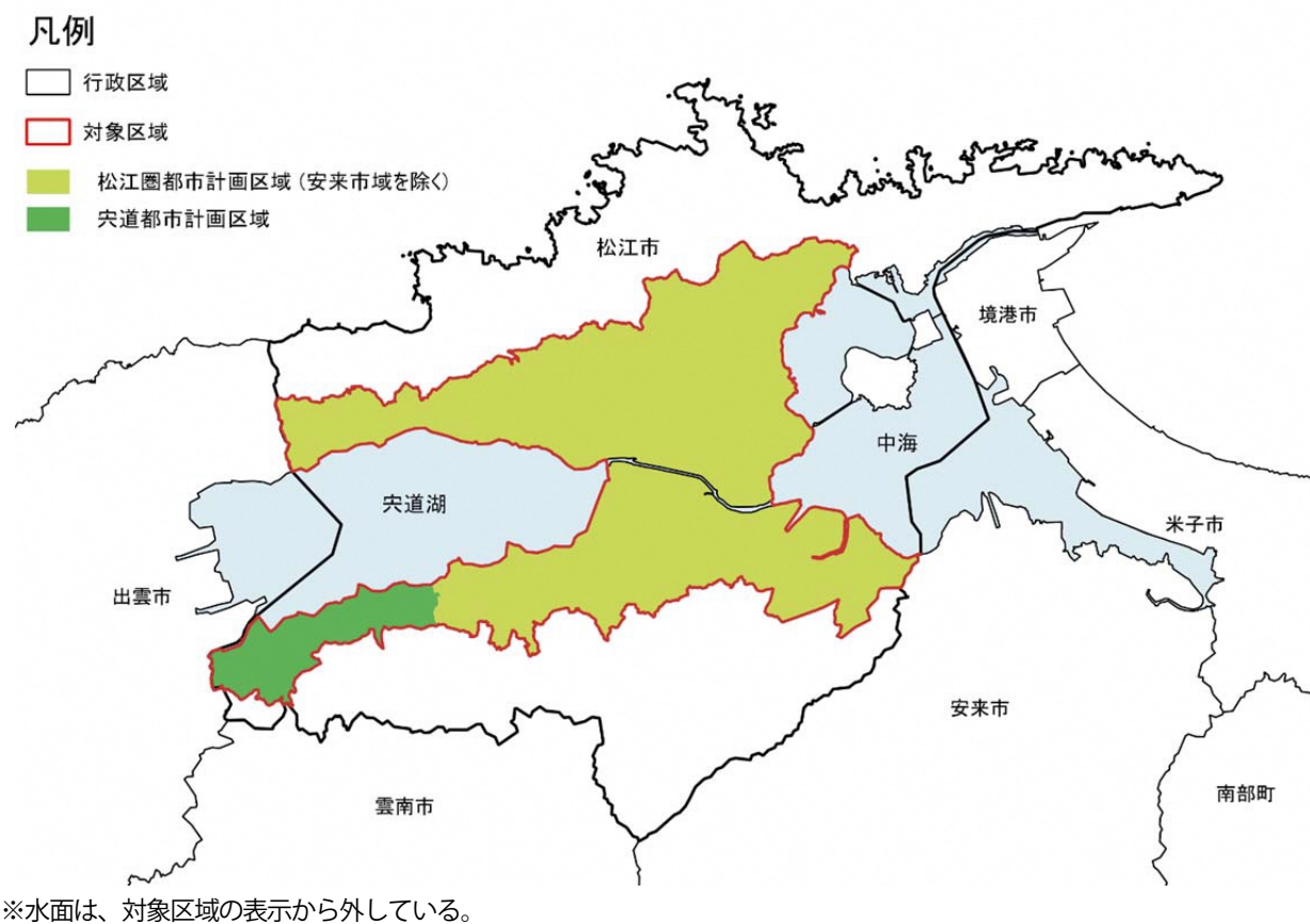
図1-2 計画の対象区域

本計画の対象区域は、都市再生特別措置法第81条第1項に基づき、松江圏都市計画区域と宍道都市計画区域の2つの都市計画区域全域とします。