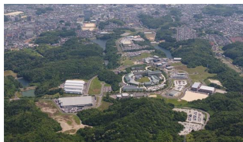
ソフトビジネスパーク島根