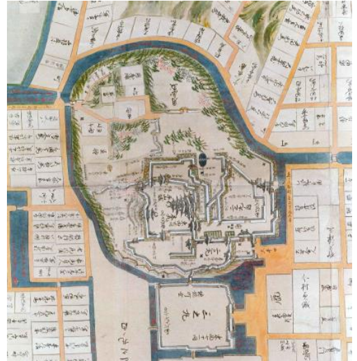
『松江御城図』延享 2～4(1745～7)年