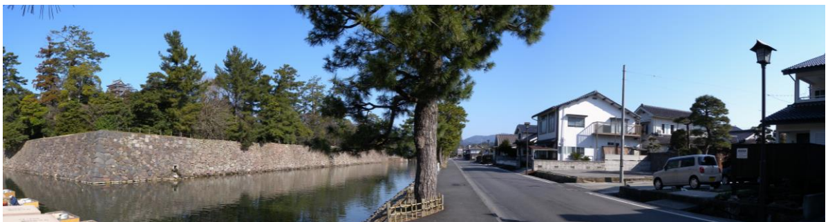
堀川遊覧船発着場付近から望む落ち着いた町並み。時の流れもゆっくりと感じられる。

本区域の周辺には、官公署や文教施設の他、松江城や塩見縄手など城下町・松江を代表する主要な観光スポットが複数存在している。本区域はこれらを繋ぐ位置にあり、落ち着いた景観に連続性を与える重要な役割を担っている。