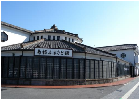
島根県物産観光館（島根ふるさと館）