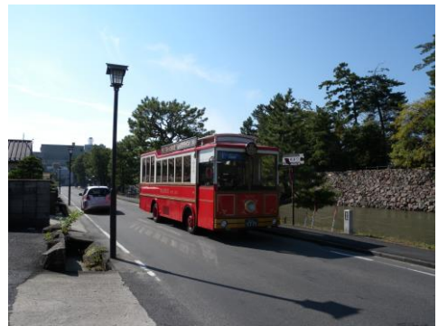
区域内を通るレイクライン