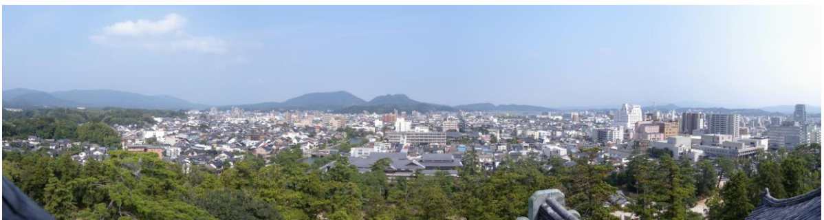
松江城天守からの眺望。北殿町界隈が望める。

城下町風情が感じられる閑静で落ち着いた町並みは住民の誇りであり、訪れる人にはやすらぎと感動を与えている。“住んでよく、訪れてよい”まちづくりを行うため、空き家の活用や重点区域の範囲拡大も含め、北殿町らしい景観を地域の活性化につなげる方策を検討していく必要がある。