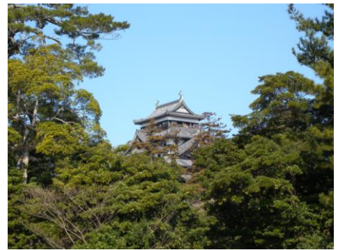
区域内から望む松江城天守

区域内からは、濠を隔てて松江城天守が望め、通勤・通学、買い物、散歩など、住民一人ひとりの様々な生活場面に、松江城のある風景がとけ込んでいる。