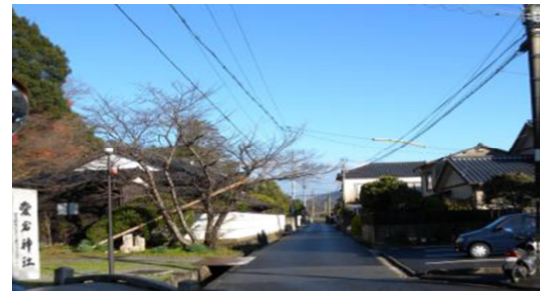
愛宕神社から清光院へと続く、道

松江開府より積み重ねられた歴史、文化や風情が息づく清光院下らしい景観を守り、育み、次世代に継承する景観まちづくりを実践することにより、生活環境の充実及び観光まちづくりへの展開を図り、住民の地域に対する誇りと愛着を深めることを目的としています。清光院及び愛宕神社から松江城天守への眺望保全や、城下町の風情に配慮した景観形成基準が定められています。