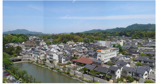
北堀町界隈の町並みを望む