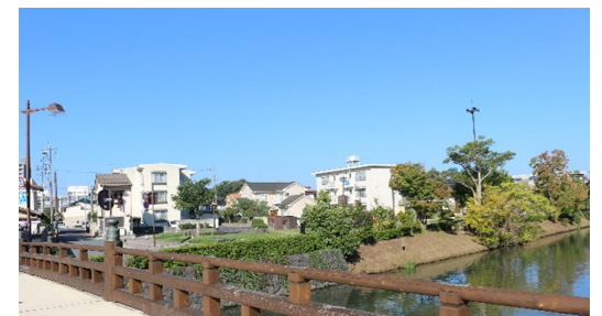
亀田橋から内中原町を望む

松江城天守や堀川からの眺望や、低層で落ち着いたまちなみに配慮した景観形成基準が定められています。