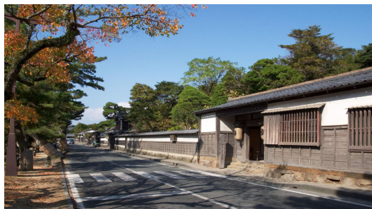
塩見縄手地区(景観地区)

下記の3地区が指定されており、松江城などの眺望景観の保全や地区の伝統的な景観に配慮した景観形成基準が定められています。