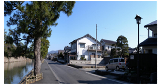
堀川遊覧船発着場付近から望む落ち着いた町並み

城下町の面影が残る水路壁の保全や観光地としてのおもてなしに配慮した景観形成基準が定められています。