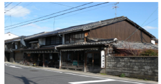
通りに面して軒を連ねる町屋