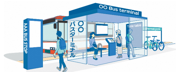
図：交通結節点の整備イメージ