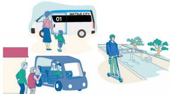
図：新たなモビリティ（AIデマンドバス、電動キックボード、グリーンスローモビリティ）