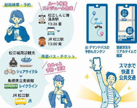
図：利便性向上に資するシステムの構築イメージ