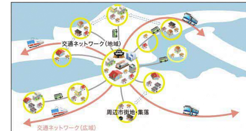
図：コンパクト・プラス・ネットワークのイメージ

松江市総合計画「MATUE DREAMS 2030」では、「市域内のバランスのとれた発展」を実現するため、中心市街地と周辺部・旧町村部の市街地や集落など既存のコミュニティを相互に交通ネットワークでつなぐ、「コンパクト・プラス・ネットワーク」の構築を目指すこととしています。