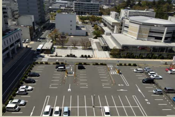
中心市街地の駐車場

既成市街地や既存集落において空き家や空き地、駐車場といった低利用地が増加しています。既存ストックの有効活用に向けて、これらの活用を図るとともに、都市全体としての活力を確保するため、地域地区や地区計画制度、開発許可制度の適用、建築基準法の遵守等により、計画的な土地利用を推進します。