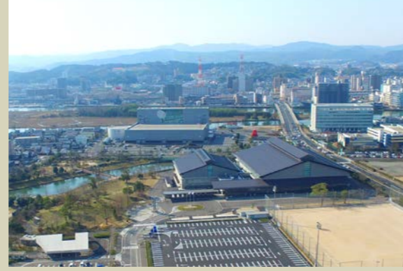
北公園（松江市立総合体育館）

道路や公園、河川、上下水道等の都市施設については、これまでの都市整備事業により、その多くが整備されています。このため、今後は、これらの施設の維持管理を適正に行うとともに、これらの活用を基本にした定住と交流がさらに促進されるよう、機能の充実を図ります。