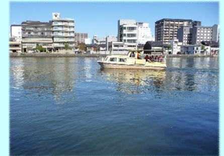
乗船社会実験(令和5年)