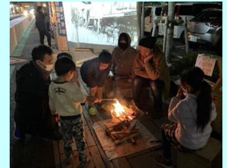
白潟本町通り社会実験(令和3年)