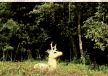
特定植物群落(八重垣神社の照葉樹林)

八重垣神社から神魂神社を結ぶ、およそ1.6kmの散策道。沿道には様々な「はにわ」が並び、石積ベンチのある休憩所があり周辺の歴史遺産に親しみながら里山の風景を楽しむことができます。ガマズミ・⑩コバノガマズミ・ミヤマガマズミの近似種がそろう、タブノキ・⑤ウワミズザクラ・⑦コシアブラ・⑫タカノツメ・スギなどがみられます。