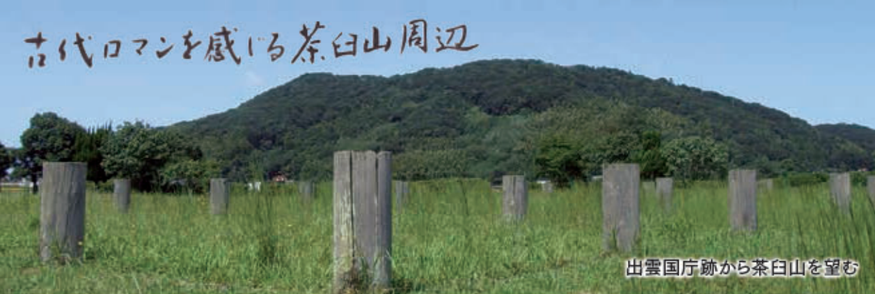
出雲国庁跡から茶白山を望む